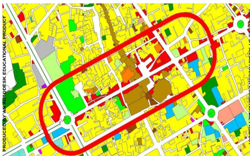
شکل ۱- محدوده بافت تاریخی ویژه و خیابان امام منبع: طرح جامع