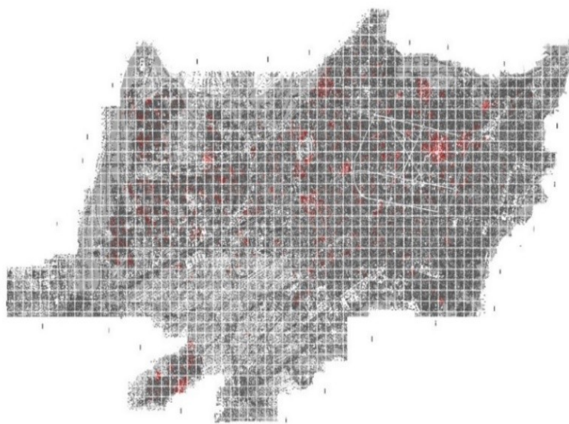
شکل ۳- شبکه‌بندی نقشه شهر برای یافتن محدوده‌های مورد توجه برای تحرک مستقل کودکان

شیوه محدوده یابی که هندسی است تنها برای تحلیل منفرد هر پرسش شونده کارایی دارد و نمی‌توان از مجموع ۱۰۲ محدوده تحرک مستقل به دست آمده، محدوده‌های دوستدار کودکان را تشخیص داد. در اغلب تحقیقات پیشین محدوده تحرک مستقل کودکان با محوریت خانه تعیین شده است (Bagheri and Zarghami, 2020). با مشخص شدن خانه در نقشه، هر کودک مجموعه‌ای از مقاصد یا محل‌هایی که بدون حضور والدین بدانجا می‌رود را مشخص کرده و محدوده تحرک مستقل کودکان به دست می‌آید. محدوده تحرک مستقل کودکان به چند شیوه قابل‌دستیابی است. در این تحقیق با توجه به هدف شناسایی محدوده‌های مورد توجه برای کودکان در مقیاس شهر، از شیوه شبکه‌بندی استفاده شده است (تصویر ۳). شبکه‌بندی ۴ پرکاربردترین شیوه مطالعه محدوده محور فعالیت‌های کودکان است (Broberg et al, 2013) که برای مطالعات با مقیاس شهری مناسب است.