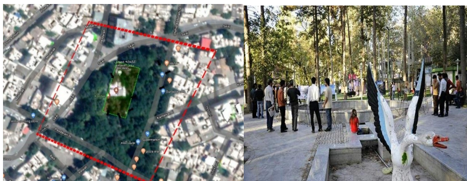
شکل ۶- محدوده شماره ۷ که به واسطه حضور پارک در مرکز محله، محدوده مورد توجه برای تحرک مستقل کودکان است

در محله قدیمی پاسداران شهر ایلام قرار دارد. محله پاسداران هسته اولیه شهر بوده و دارای خانه‌های با قدمت بالایی است. الگوی خانه‌های حیاط دار با سطح اشغال حداکثر ۶۰٪ بر این محله حاکم است. به واسطه سابقه این محله، مراکز هم‌چون مسجد جامع شهر، مراکز فرهنگی، اولین کتابخانه شهر، کافه‌های هنری و مغازه‌های فروش صنایع دستی و حرفه‌های محلی در این محله قرار گرفته‌اند. نظام دسترسی ارگانیک، معابر کم‌عرض و پرشده از چنارهای بلند از شاخصه‌های این محدوده تحرک مستقل کودکان است (تصویر ۶).