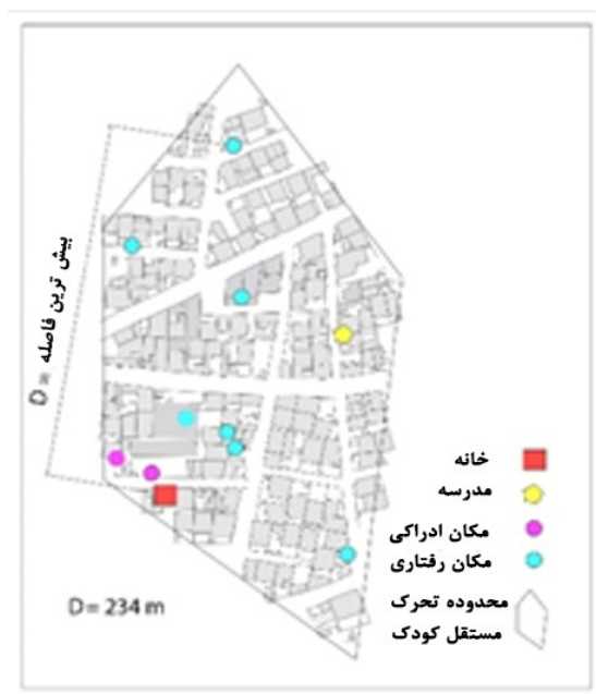
شکل ۲- نمونه‌ای از نقشه‌های رفتاری- ادراکی و شیوه ثبت فعالیت‌های مستقل از والدین برای هر کودک

به منظور کشف محدوده‌های مورد توجه برای تحرک مستقل کودکان می‌توان از ابزارهای مصاحبه، مشاهده، نقشه‌های رفتاری و بانک‌های داده رفتاری شهروندان استفاده نمود (ضرغامی و باقری، ۱۳۹۸). شهر ایلام فاقد بانک اطلاعات رفتار شهروندی است. استفاده از مشاهده‌های ساده و مصاحبه‌های باز، نیازمند صرف زمان، هزینه و استفاده از گروه محققان است که برای این تحقیق میسر نبوده است. ترسیم نقشه‌های رفتاری به کمک پرسشنامه از کودکان به جهت اتکا به اطلاعات عینی نقشه‌های شهری، سهولت استفاده برای کودکان و حذف محقق از جمع‌بندی توزیع محدوده‌های تحرک مستقل کودکان، انتخاب شده است. بنابراین از پرسشنامه‌های نقشه محور جهت اخذ نقشه‌های رفتاری- ادراکی در محیط نرم‌افزار ArcGIS v.10.1 استفاده شده است. پرسشنامه نقشه محور شامل لیستی از مکان‌های رفتاری و ادراکی است که هر دانش‌آموز به شرط عدم همراهی بزرگسالان، آن مکان را به کمک محقق روی نقشه علامت‌گذاری کرده است (تصویر ۲).