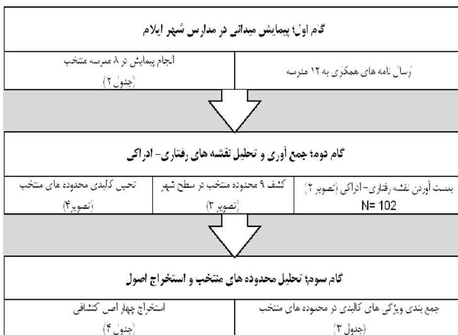
شکل ۱- مراحل انجام تحقیق.