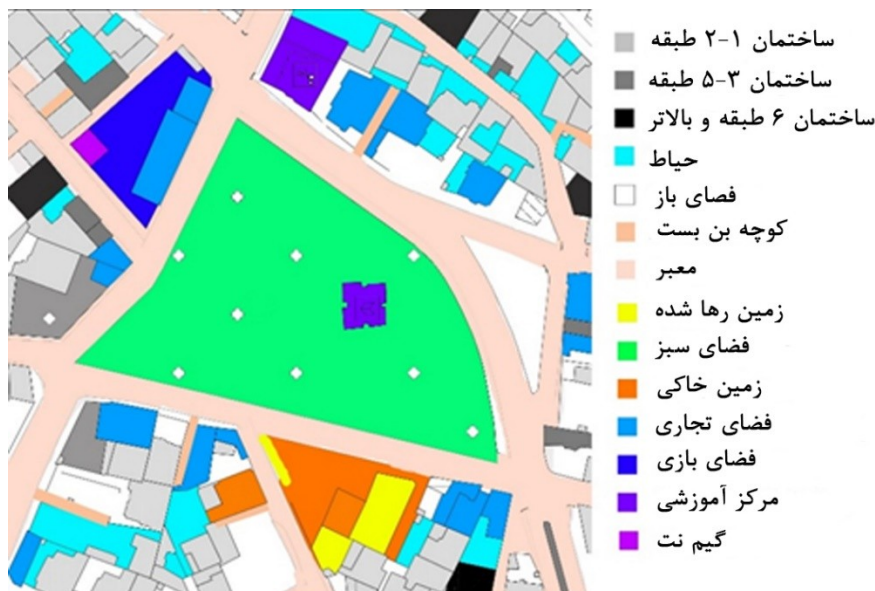
شکل ۴- نمونه تحلیل محدوده‌های منتخب تحرک مستقل کودکان

ابعاد مربع‌ها در تحقیقات پیشین از ۲۵۰ تا ۱۰۰۰ متر متفاوت است. مبنای ابعاد شبکه‌بندی نیز در هر تحقیق با اتکا با شیوه توزیع نرمال رفتار بر مساحت شهر بوده است. در تحقیق حاضر با تحلیل ۱۰۲ نقشه رفتاری- ادراکی و ۶۲٪ مشارکت کودکان، مجموعاً ۱۸۹۶ مکان رفتاری- ادراکی ثبت شده است. با فرض توزیع نرمال ۱۸۹۶ مکان رفتاری- ادراکی در سطح شهر با مساحت ۲۲ هزار کیلومترمربع، نشان می‌دهد که به ازای هر مربع با ابعاد ۲۵۰ متری، ۳۵۵ مکان ثبت خواهد شد (تصویر ۳). محدوده‌هایی با بیشترین توزیع نرمال مکان‌های رفتاری- ادراکی به‌عنوان محدوده‌های دوستدار تحرک مستقل کودکان انتخاب و تحلیل قرار گرفته‌اند (تصویر ۴). محاسبه مساحت کاربری‌های متنوع، فضای باز و سبز توسط ابزار Area و محاسبه عرض معابر، پیاده‌روها، ارتفاع ساختمان‌ها و فواصل مقاصد تحرک مستقل کودکان از طریق ابزار Cost Distance انجام شده است. تعداد تقاطع‌ها شمارش شده است. در نهایت پس از تحلیل ۱۰۲ نقشه رفتاری- ادراکی شاخصه‌های محیطی مؤثر بر تحرک مستقل کودکان جمع‌بندی شده است.